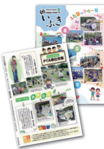
出雲崎町立出雲崎小学校PTA