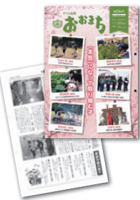
上越市立天町小学校PTA