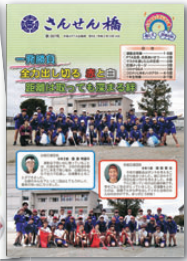
胎内市立中条小学校PTA