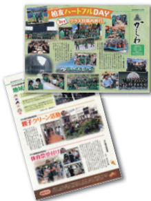
長岡市立東北中学校PTA