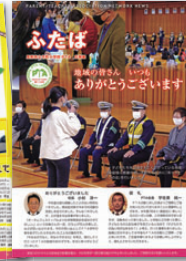
見附市立今町小学校PTA