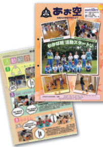
糸魚川市立糸魚川小学校PTA