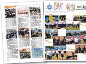
中学校の部 優秀賞 妙高市立新井中学校 父母と教師の会