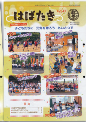
小学校の部 最優秀賞 糸魚川市立 能生小学校PTA