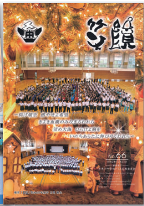
中学校の部 最優秀賞 糸魚川市立 糸魚川中学校PTA