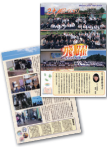
見附市立見附中学校PTA